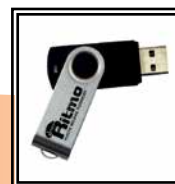
Software Ritmo Transfer