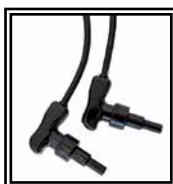
Conectores 90° Universales 4-4,7 mm