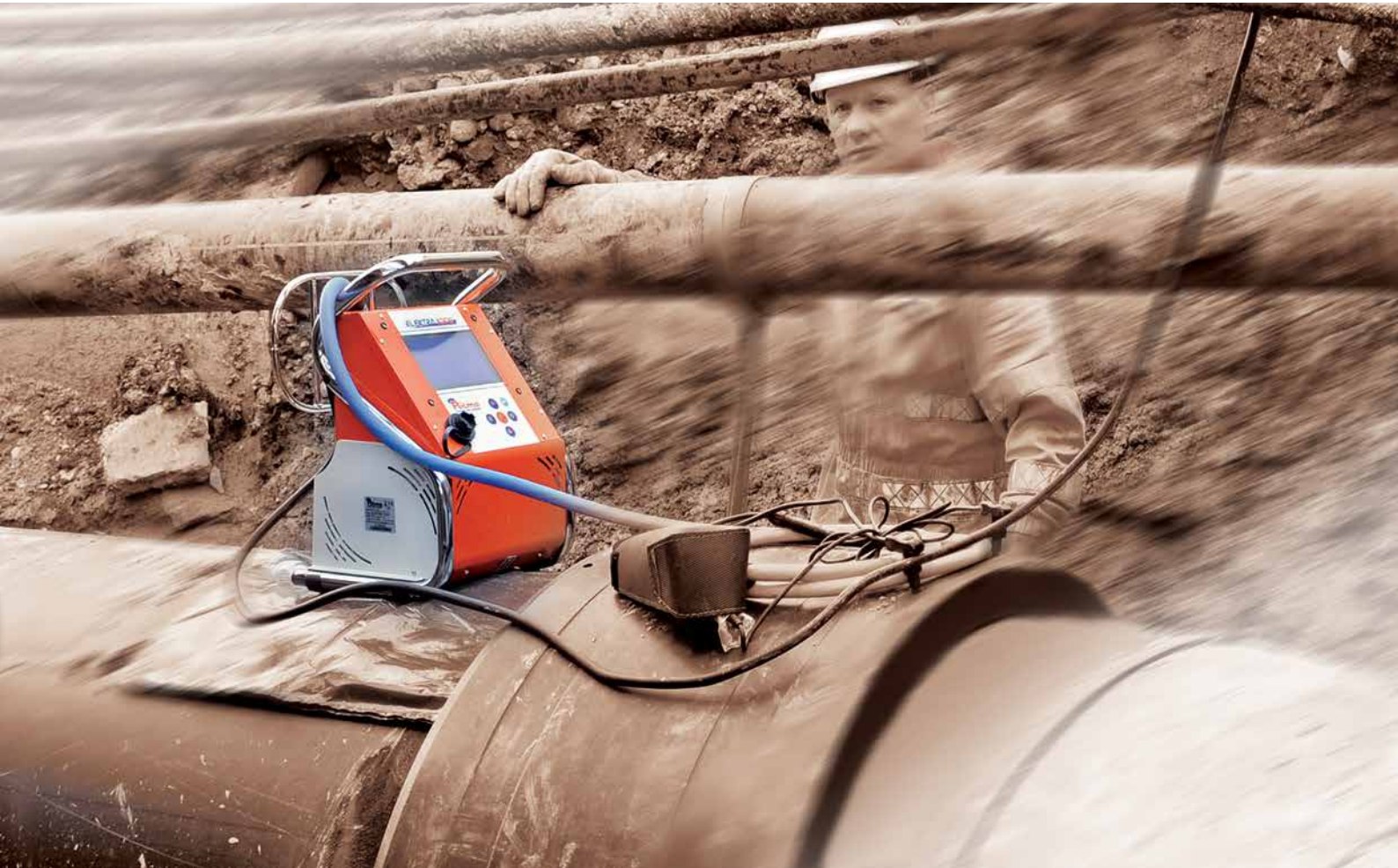
* RANGO DE TRABAJO Ø mm