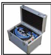
Caja de Transporte